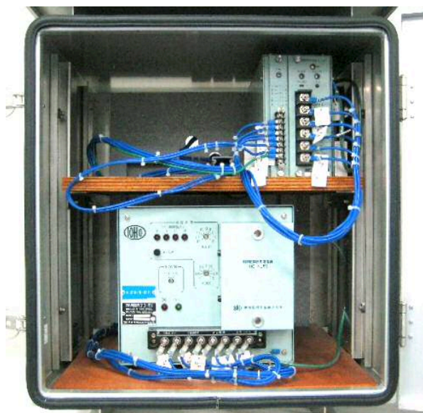
機器収納側実装写真