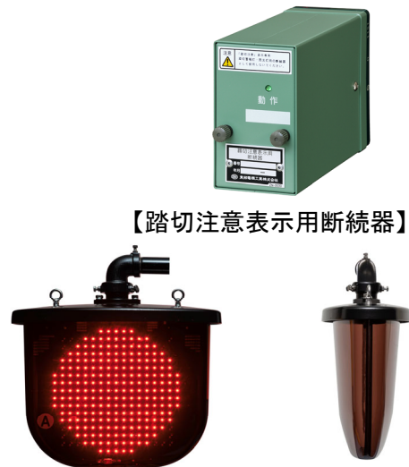
【列車接近時・裏面も同様です】