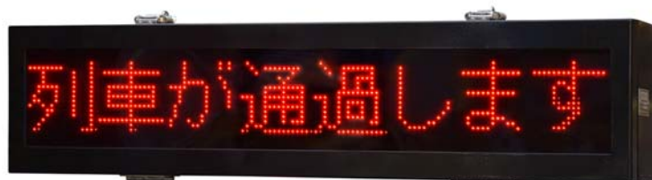
【写真は SD50571-01 です】