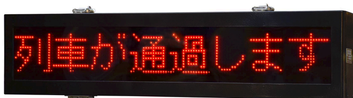
【写真は SD50571-01 です】