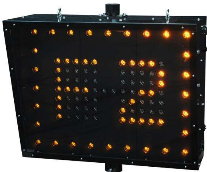
【表示器 3 形】